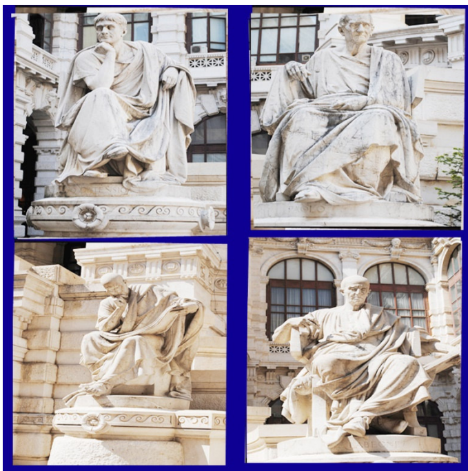
Le statue dei giuriconsulti nel Cortile d'Onore: Ortensio, Paolo, Ulpiano e Labeone